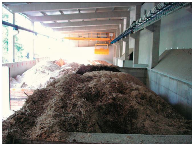
Obr. 3 Skládku paliva, denní zásobník a manipulační jeřáb

další rozšíření tepelné sítě o dalších cca 36 objektů a o cca 1,5 km rozvodů. Realizace nových stanic a rozvodů však bude závislá na financích, neboť na rozšíření již nejsou dotace. Noví zájemci budou zřejmě muset za připojení již něco zaplatit.