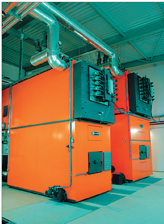
Obr. 2 Dva teplovodní kotle Schmid typ UTSR 1,6MW a UTSR 2,4 MW

Dle údajů provozovatele za loňskou sezónu, kdy byla tuhá zima, bylo v období 10/2005 až 05/2006 vyrobeno 22 258 GJ, spotřeba paliva byla 12 327 prost. metrů. Cena tepla byla 300 Kč/GJ, bez DPH. Provozovatel je s ekonomikou velice spokojený. Většina připojených obyvatel je také spokojená. Jak se ukázalo, také obyvatelé, kteří se původně nepřipojili, uvažují teď o dodatečném připojení. V současné době je zpracovaná dokumentace na